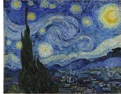
Van Gogh STARY NIGHT