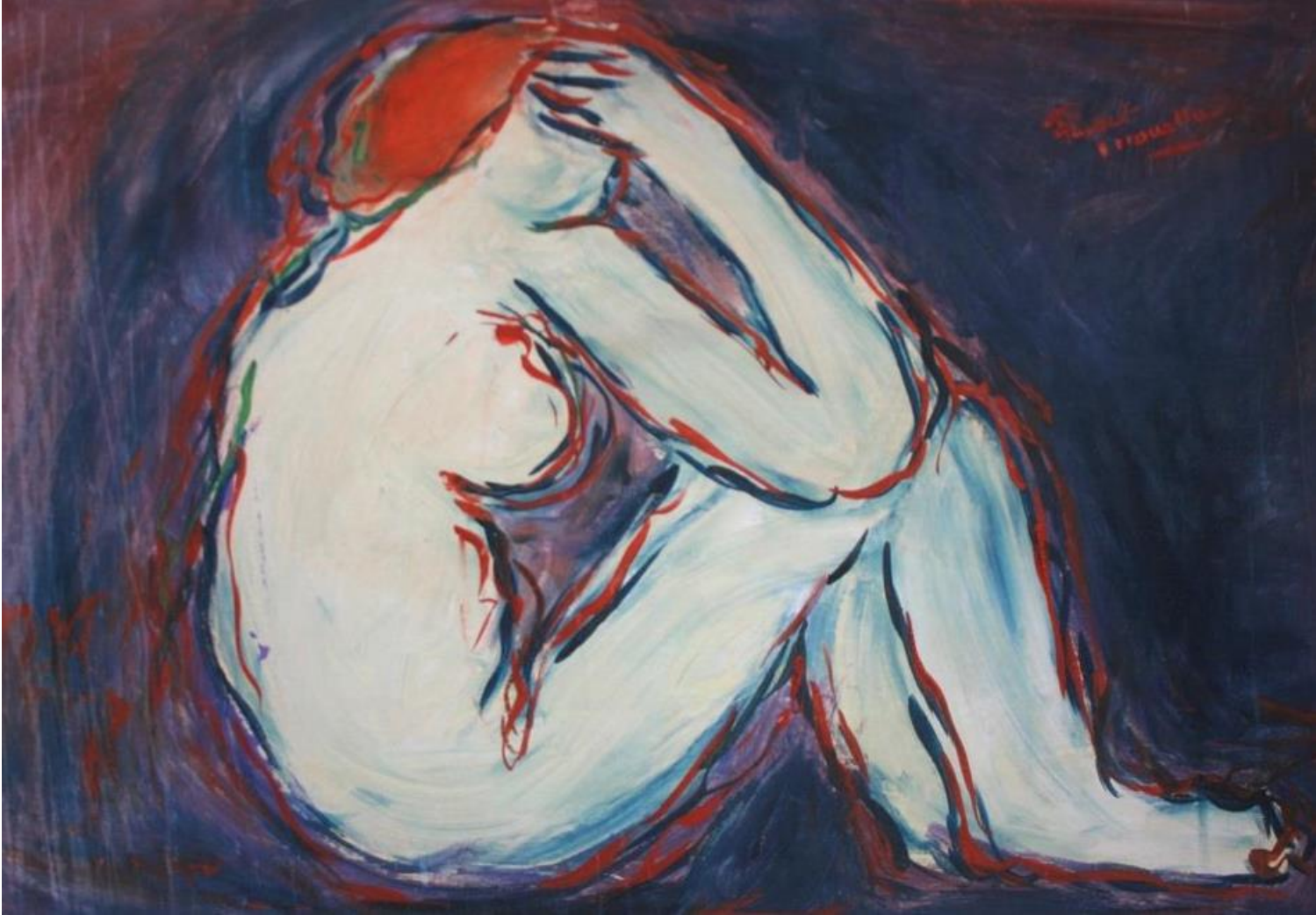
Fikret Mualla AMOUR ETERNEL

Şimdi ben Fikret Mualla'nın Amour Eternel adlı yapıtı ile buluşmaya gidiyorum. İsterseniz siz de bana katılın.