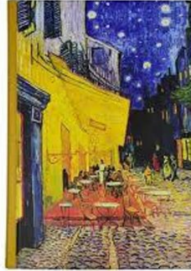
Van Gogh NIGHT CAFE